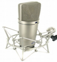
Großmembranmikrofon auf Spinne